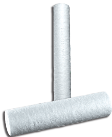
Figure 1: Filtres à cartouche en profondeur Purtrex