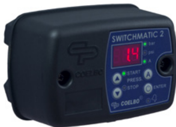
SWITCHMATIC 1 SWITCHMATIC 2 SWITCHMATIC 2/in-out